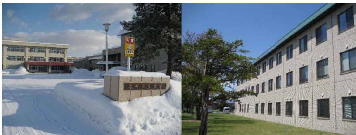
(写真：名寄市立大学構内 左；正門、右：新館)

名寄市立大学は2006年4月に新設されました。2008年4月現在、保健福祉学部栄養学科、看護学科、社会福祉学科、短期大学部児童学科で構成される日本最北の公立大学です。今後とも、地域に根ざした教育を展開していきたいと思っています。どうぞよろしくお願いいたします。