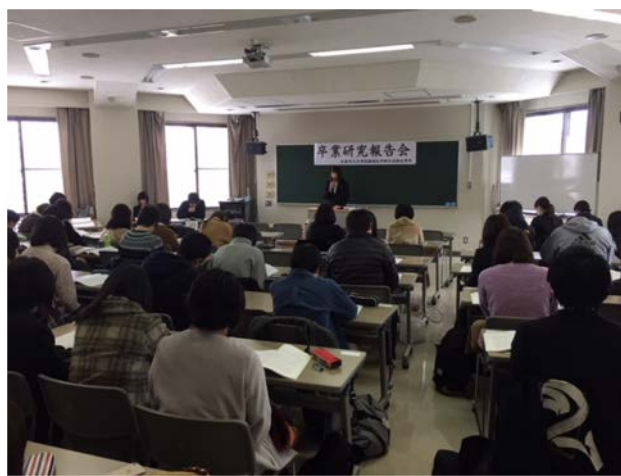
社会福祉学科卒業研究報告会（2018年2月16日）