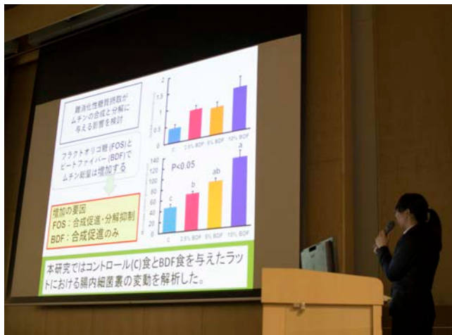
栄養学科卒業論文発表会（2017年11月27日）

2017年度の締めくくりとして、保健福祉学部栄養学科、看護学科、社会福祉学科の3学科では卒業論文の発表会・報告会が開かれました。また、社会保育学科では2年生が地域公演を行いました。