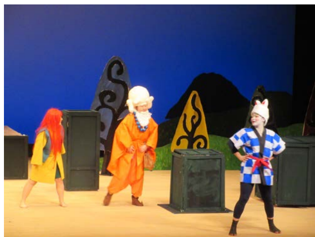
社会保育学科2年生地域公演（2018年2月18日）