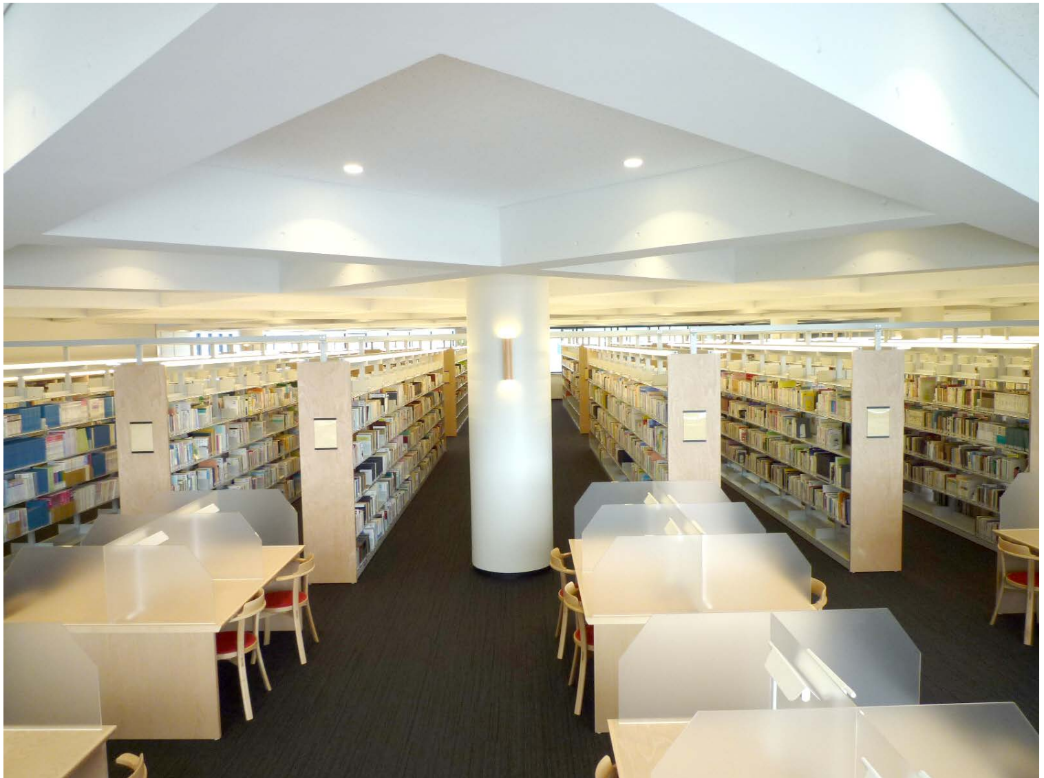
2017年4月に開館した新図書館