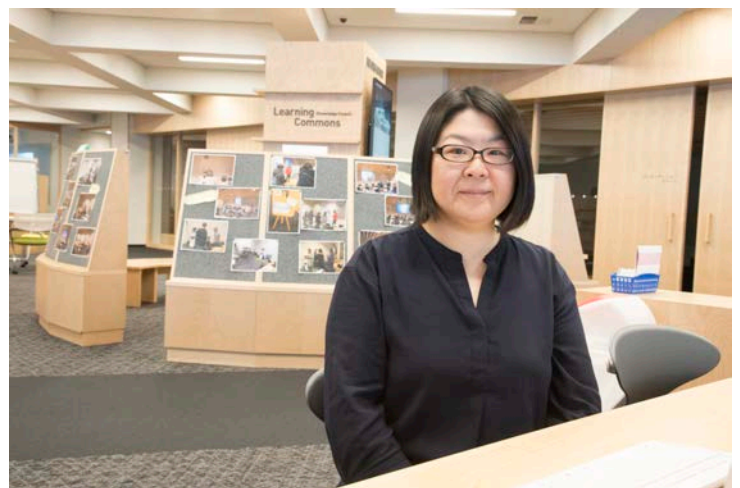
（写真：西田麻衣子 図書館副館長）

北海道は広大で、私の故郷である十勝からは遠く離れているのですが、名寄に数か月暮らしまして、故郷に帰ってきたように感じています。