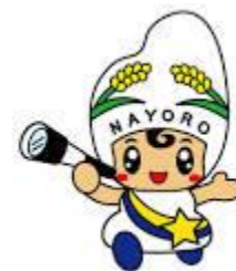
名寄市マスコットキャラクター「なよろう」