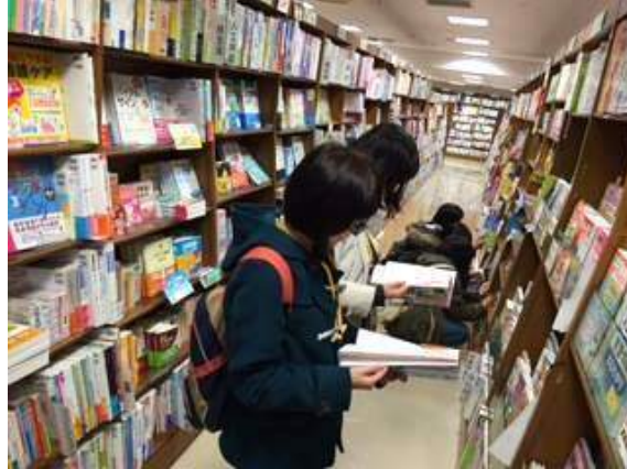
[真剣に本を選ぶバイヤーたち]