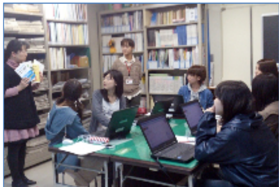
《本館ガイダンス風景》

後期は、データベースの使い方など、文献検索を中心に行います。それぞれ要望に応じて行いますので、お気軽にお申し込みください。