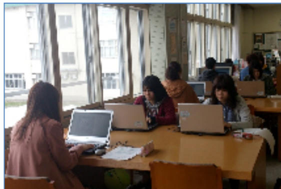
《分館ガイダンス風景》