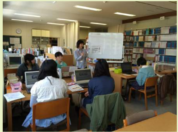
3・4年生ガイダンス風景