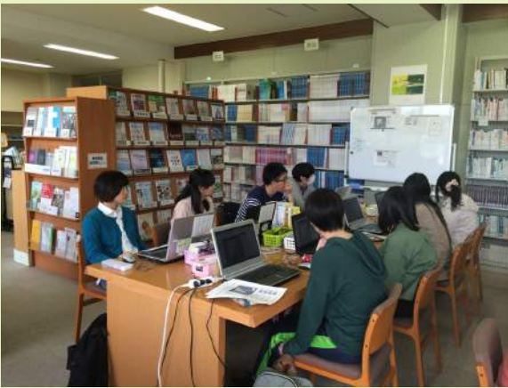
1年生ガイダンス風景