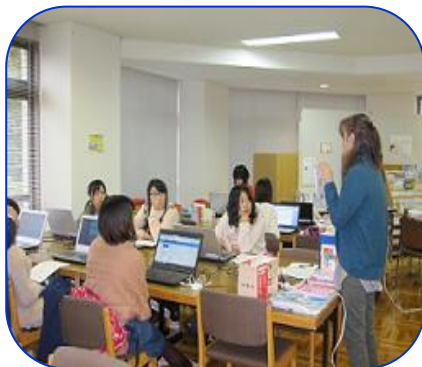
《本館ガイダンス風景》