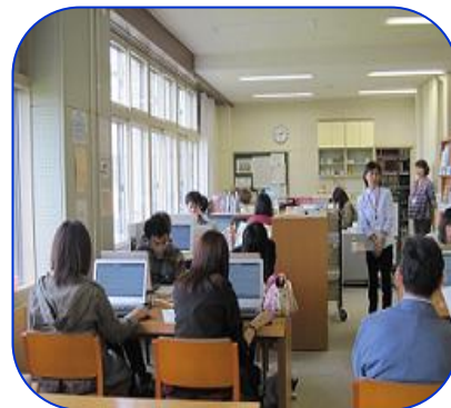
《分館ガイダンス風景》