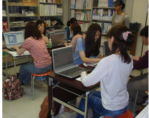
【本館・ガイダンス風景】