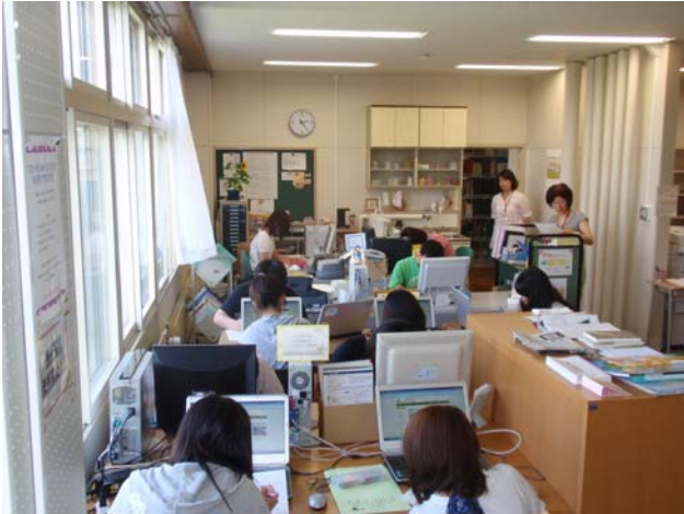
【分館・ガイダンス風景】

後期は、データベースの使い方など、文献検索を中心に、要望に応じて行いますので、お気軽にお申し込みください。