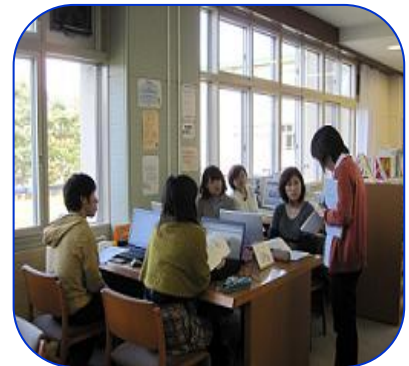
《3年生ガイダンス風景》

今から、さまざまなテーマに向けた文献検索をしておいて無駄にはならないはずですので、ぜひガイダンスに参加してみてください。その場でしか聞くことのできない文献検索の小技など、お得な情報がありますよ！