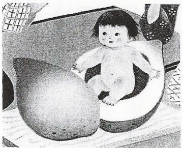
『ももたろう』A(文不詳/岩崎良信, 絵/小学館育児絵本)

授業で学生たちにこの絵を見せ、どちらが好きかときくと、九割以上、つまりほとんどの学生がAと答えます。「かわいい」というのです。二〇〇八、〇九年になると、赤羽末吉の描く「ももたろう」は「気持ち悪い」という学生まで現れるよう